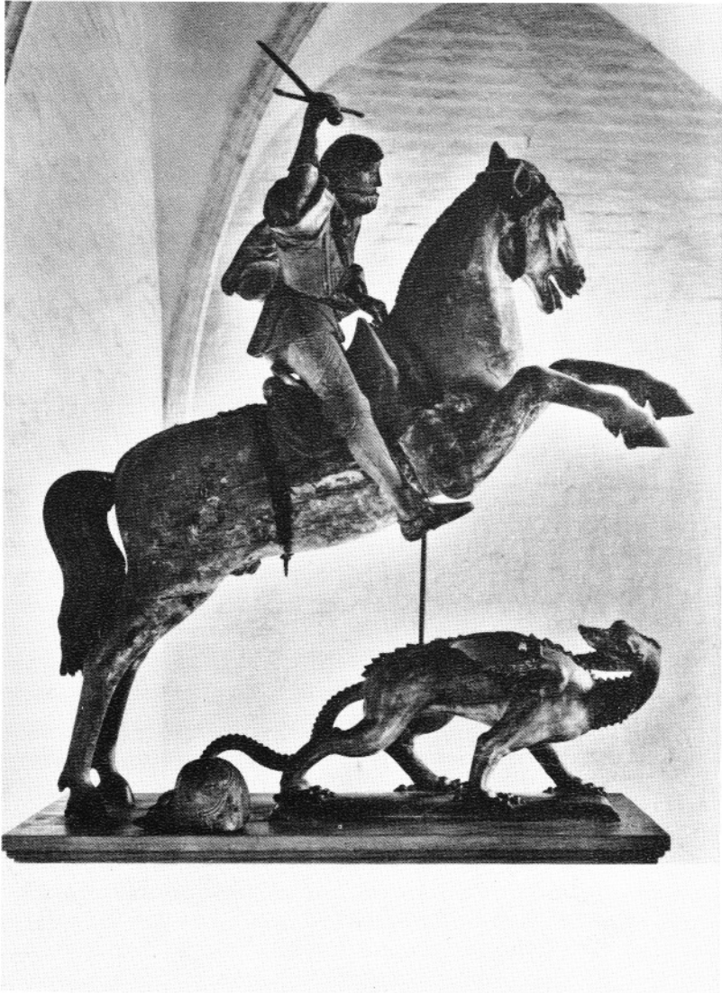
LUBECK - ST. Annen-Museum St. Jürgen, von Henning von der Heide, 1505.