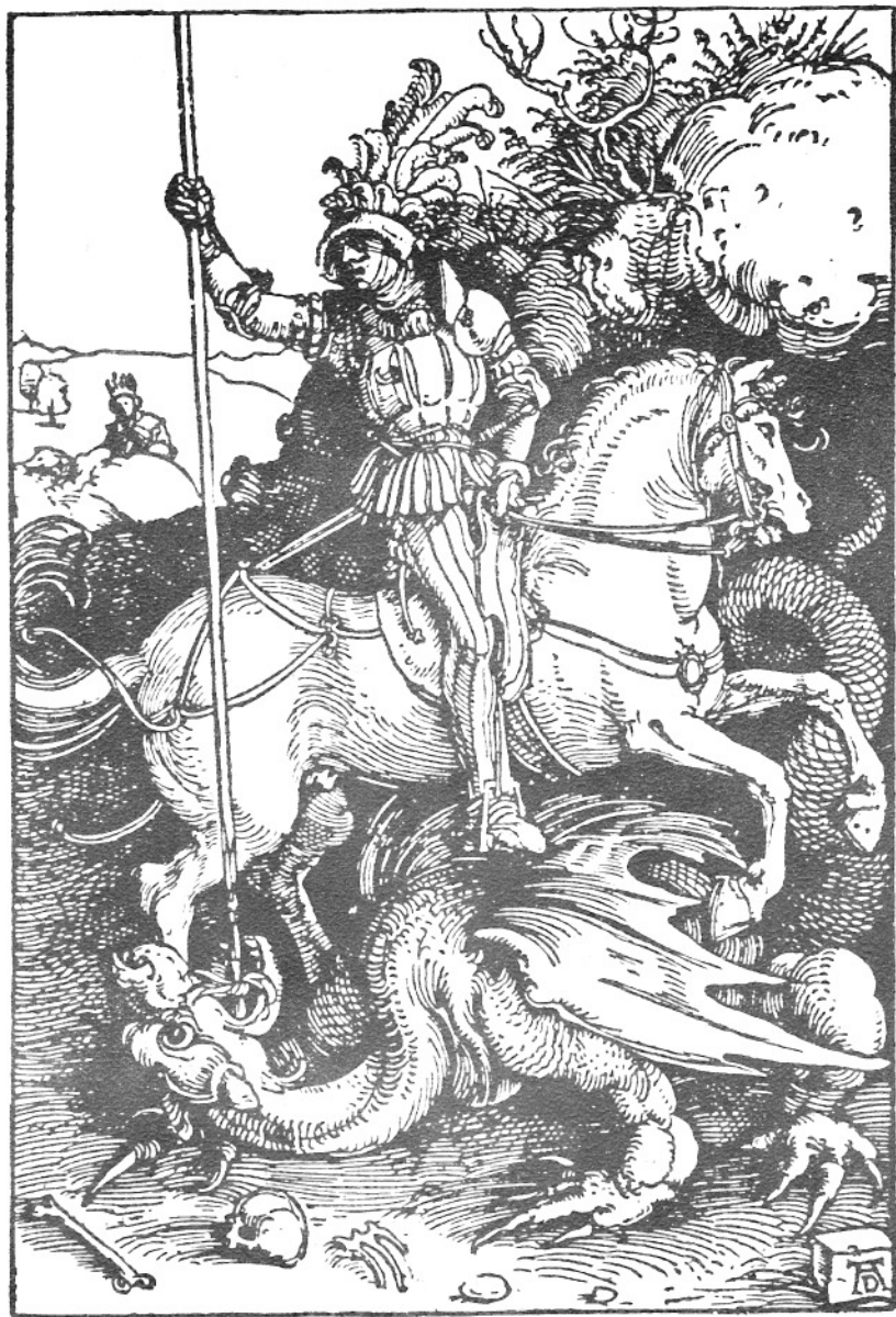
ALBRECHT DÜRER. TRÆSNIT